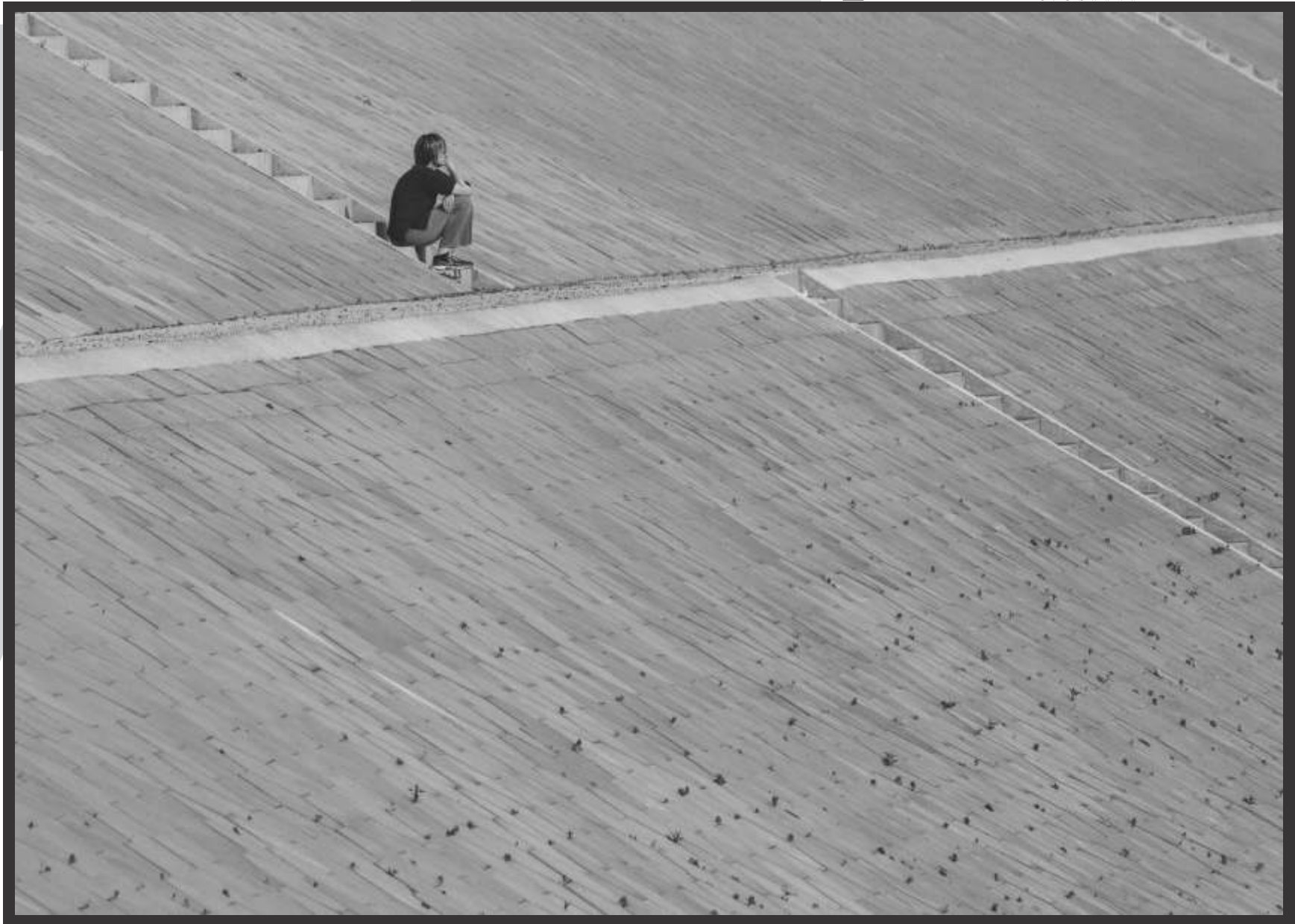
Kristina Matijaš (1972, Sisak, Hrvatska), "Na sigurnoj udaljenosti"

Članica Foto kluba Zagreb i Foto kluba Sisak, koja se amaterski bavi fotografijom od 2015. godine.